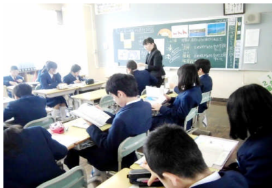
コの字型の席による協同的な学習