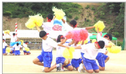
昨年度の体育祭から

長かった夏休みが終わり、8月25日に2学期の始業式を行ったところ、全校生徒全員が元気な顔を見せてくれました。この夏には4年に一度のオリンピックがブラジルで開催されましたが、日本人選手が大活躍をして日本国民に元気と大きな感動を与えてくれました。私も寝不足になりながらテレビの画面に釘付けになっていましたが、多くの試合で「苦しかった」「力を出し切った」という日本人メダリストたちの