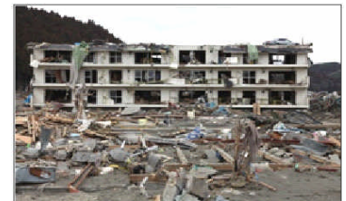
東日本大震災より

始業式の始まる前に「地震」を想定した避難訓練を実施しました。これは9月1日の防災の日先駆けて行ったものです。緊急地震速報の後、頭や体を守るために机にもぐり、その後体育館へ移動しました。体育館では今から約90年前の9月1日に発生したM7.9、震度7の関東大震災や2011年に起こった東日本大震災、そして今年4月の熊本地震にふれ、地震は予期せず突然起こるもので、どこにいてもどんな時でも、地震が起こったときには自分の体を守ることを何より優先すること、例えばガラスが落下してくることもあるので高い建物から離れること、そして普段から危険を予知する感覚を磨いておくこと、などを話しました。次回は原子力防災に関する避難訓練を予定しています。