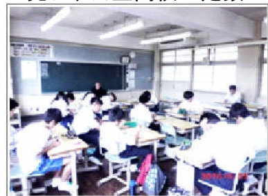
自主学習会の様子

先日、公立高校の定数が発表され、舞鶴市内では西舞鶴高校の普通科の定数が40人減となり、その結果、東舞鶴・西舞鶴ともに普通科200人定員となりました。