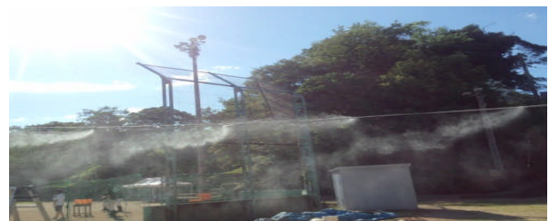
「ミストシャワー」始めました