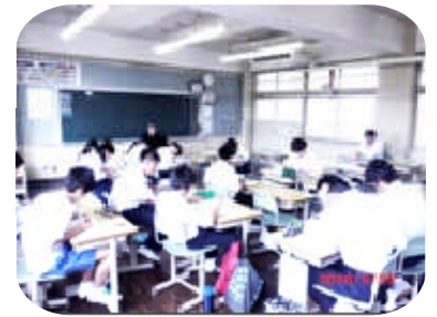
自主学習会の様子

学習班の仲間に聞ける関係を作ってきました。そして生徒も「学びの委員会」を立ち上げ、全校的に学習に意識を向けています。さらにテスト前の6月25日(土)には自主学習会を行い、多くの生徒が自主学習に取り組みました。一学期は、月に1回授業を公開し感想やご意見をいただきました。2学期も月に1回は生徒の様子を見ていただく機会を設けますので、その際には学校へお越しください、感想をお聞かせください。