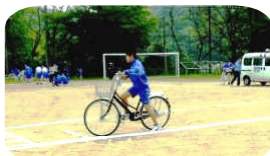
一旦停止、左右確認!

4月25日に、舞鶴警察署交通課からお二人、大波駐在所から小牧さん、そして4名の地域交通安全推進委員をお迎えしました。はじめにDVDで近年の自転車事故の事例から詳しく学び、次にグラウンドで1年生全員が安全運転実技講習を受けました。交通安全への意識を高め加害者にも被害者にもならないよう、ご家庭でもご指導をよろしくお願いします。