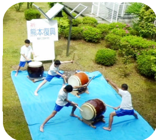
熊本地震からの復興を祈念して

新入生も中学校生活になじんできました。4月24日の授業参観には、100名を超える保護者の皆様に来校いただき、誠にありがとうございました。皆様方からの励ましの声を力に「共に学び合える学校づくり」による、質の高い学力の育成に一層努めてまいります。