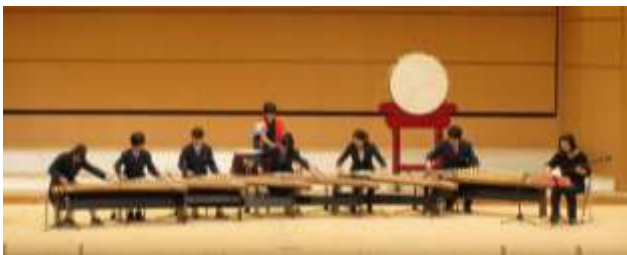
(舞鶴市総合文化会館大ホール)